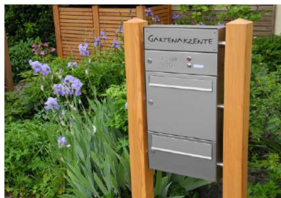
Kommunikationselement B1 - COM

Gartenakzente Murnauer Str. 28 82438 Eschenlohe Tel.: 08824 / 929 280 Fax: 08824 / 929 264 Email: post@gartenakzente.de www.gartenakzente.de